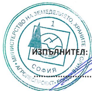
ИНЖ. РУМЕН РАЙКОВ